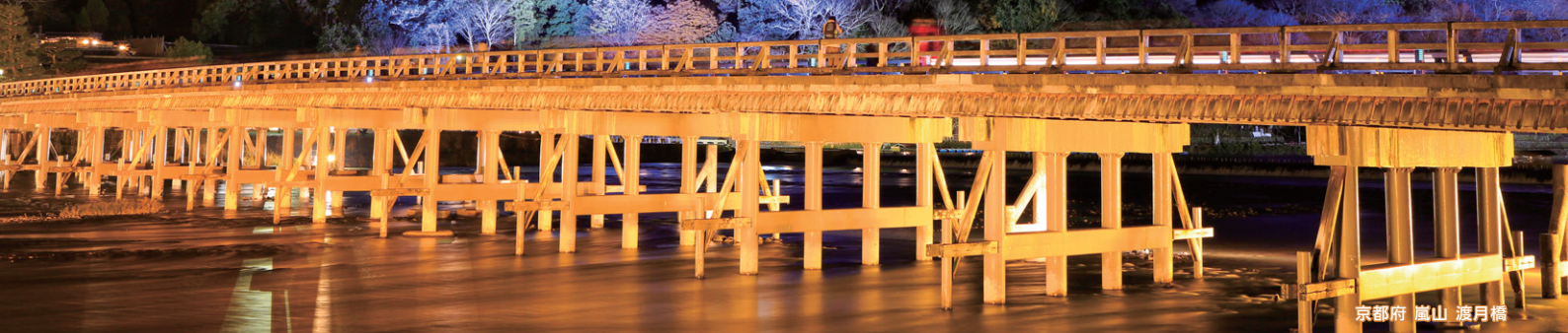
京都府 嵐山 渡月橋