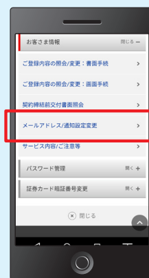
スマートフォンの場合