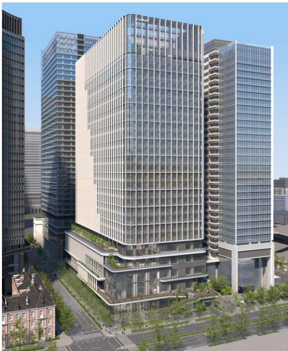
「MUFG本館」外観イメージ