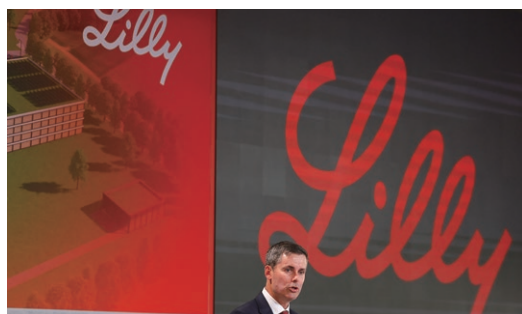
2017年、CEOに就任したデイビッド・リックス氏

この躍進を支えたのが、イーライリリー会長兼CEOのデイビッド・リックス氏だ。新薬開発の「選択と集中」を進め、低迷していた同社の業績を回復させた。