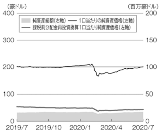
豪ドル・ポートフォリオ