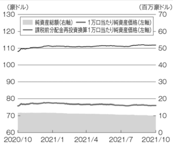
豪ドル建 豪ドルヘッジ 毎月分配クラス