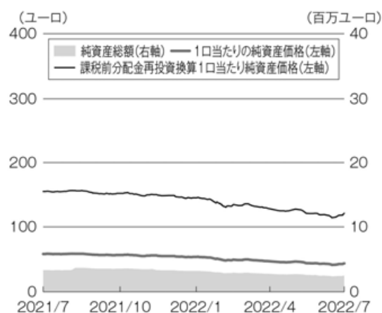
ユーロ・ポートフォリオ