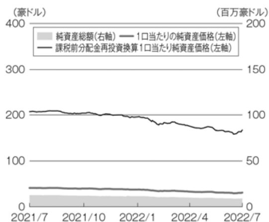
豪ドル・ポートフォリオ